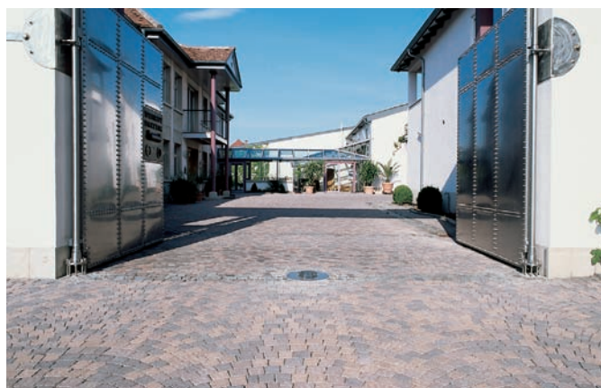
Le système de pavage Béganit, mélange des trois bruns