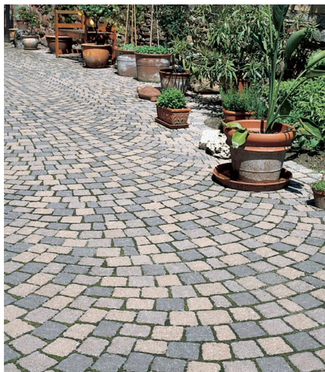
Le système de pavage Béganit, mélange des trois bruns

Existant dans un lot de sept pavés, Béganit est livré dans trois teintes naturelles et dans un mélange de couleurs supplémentaires (trois nuances de bruns différents). La longueur des pavés varie de 5 cm à 10,2 cm, la largeur est de 9,2 cm et l'épaisseur de 8 cm.