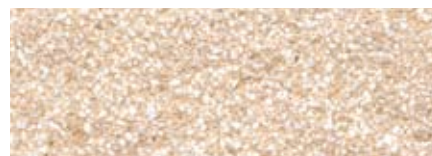
jura clair PS (grenillé)