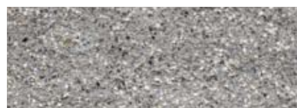
gris clair PS (grenillé)